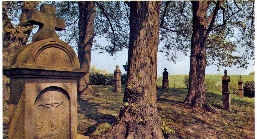
Sieben Fußfälle stehen in unmittelbarer Nachbarschaft zur Kapelle. Früher kamen die Menschen in großer Zahl hierhin, um zu beten.